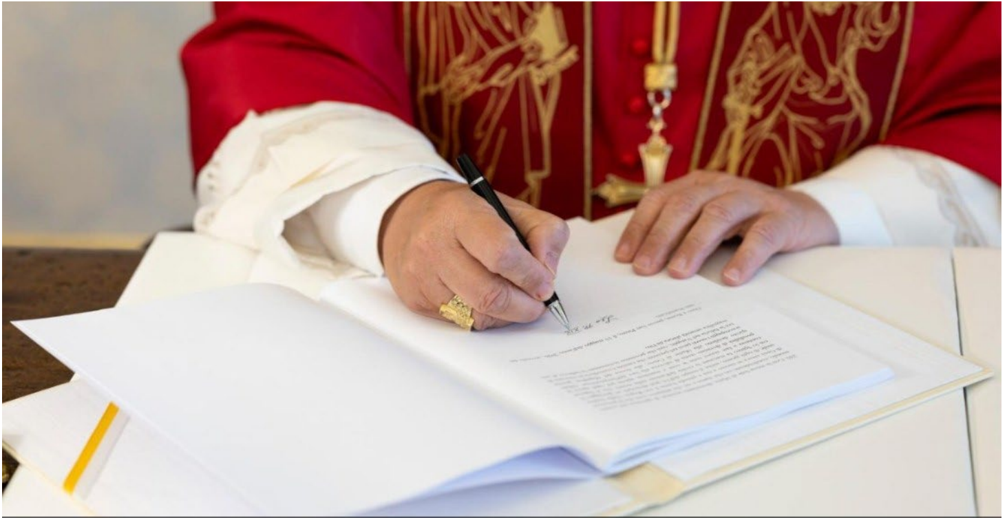
Le Pape Léon XIV signe sa première encyclique "Magnifica humanitas", le 15 mai 2025 au Vatican.