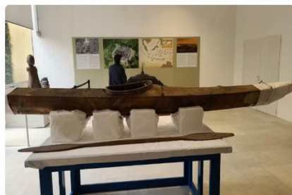
Un kayak inuit est exposé dans l'un des musées du Vatican. Il fera partie des dizaines d'artefacts retournés à des communautés autochtones au Canada.

Soixante-deux objets sacrés appartenant aux peuples autochtones sont de retour au pays après trois ans de négociations avec le Vatican. Parmi ces artefacts figure un rare kayak inuit centenaire, conservé depuis un siècle dans des musées et les coffres du Vatican. Ils sont arrivés à l'aéroport de Montréal, où ils ont été remis aux chefs des Premières Nations, des Inuits et des Métis, marquant un moment historique qui pourrait ouvrir la voie à d'autres restitutions, notamment en provenance d'Angleterre. Le reportage de Danielle Kadjo.