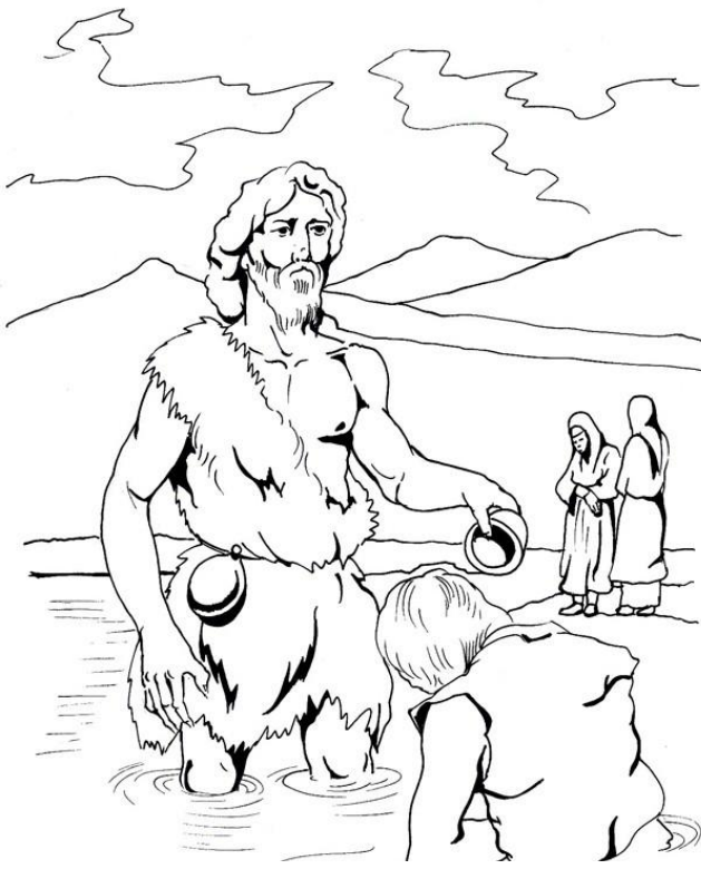
Jean le Baptiste