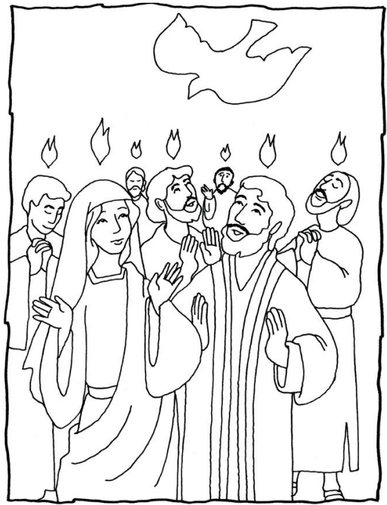
Jésus envoie l'Esprit Saint