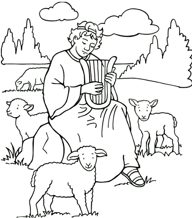
Le roi David