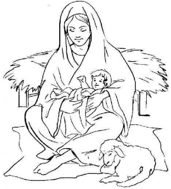
Jésus est né