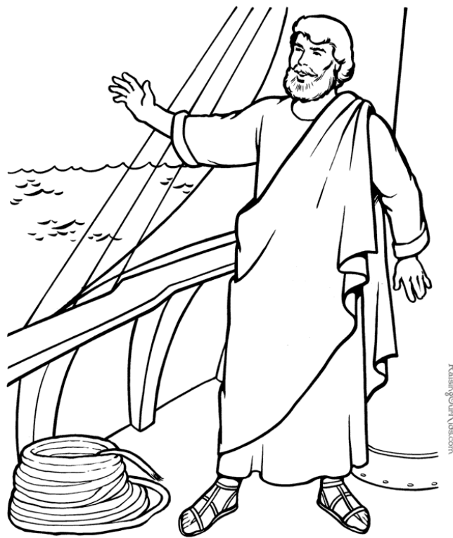
Paul annonce la Bonne Nouvelle