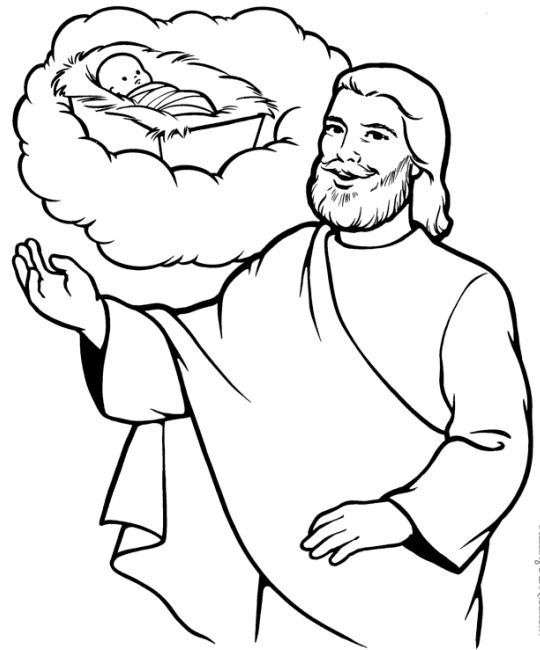
Le prophète Isaïe