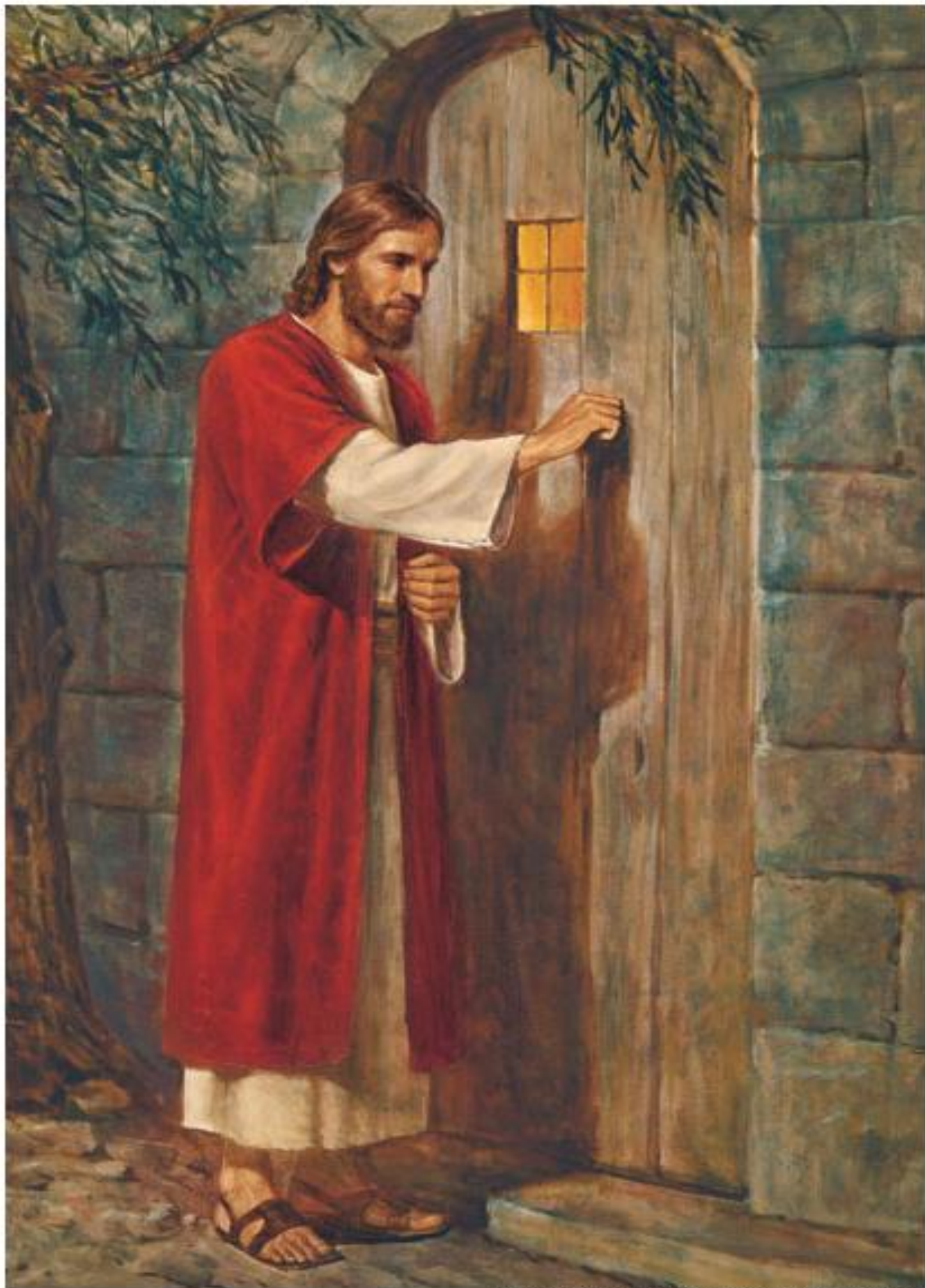
Jesus Knocking at the Door, by Del Parson, © 1983 IRI